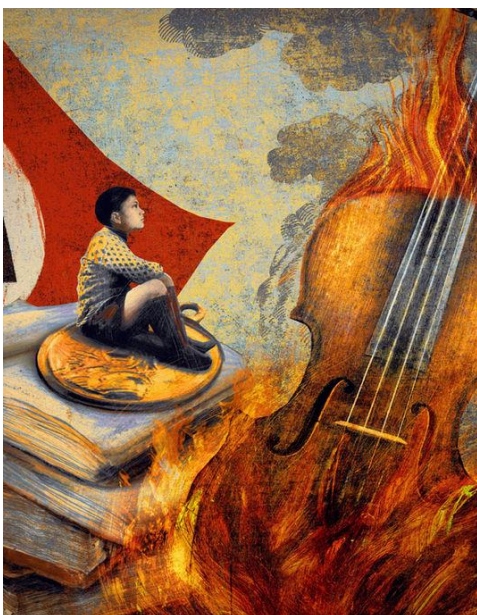
Une illustration d'Ale+Ale. WWW.ALE-ALE.NET

http://www.voixauchapitre.com/archives/2015/Cabre_mauvignier_lemonde_2013.pdf