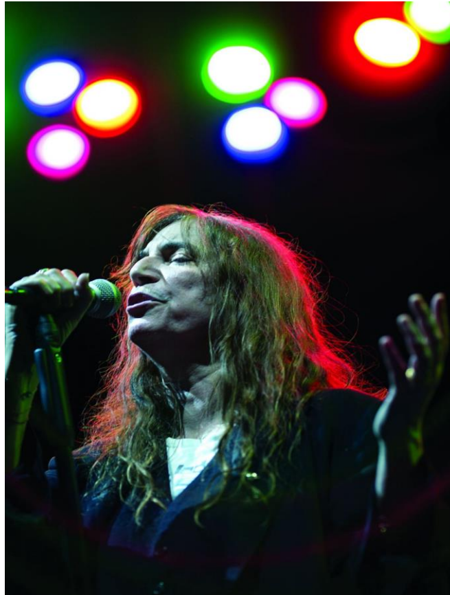
Patti Smith en 2012, lors d'un spectacle à Montréal