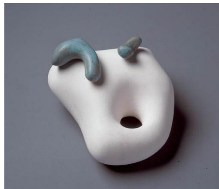
Nombriil et Deux Idées , Hans Arp, 1932, sculpture, plâtre blanc et plâtre teinté bleu, Musée d'Art moderne et contemporain de la Ville de Strasbourg