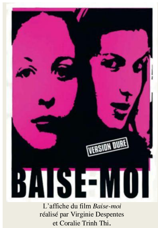
L'affiche du film Baise-moi réalisé par Virginie Despentes et Coralie Trinh Thi.

Et aussi l'importance pour elle d'auteures militantes comme Betty Friedan ou Judith Butler. Ce sont ces dernières qui ont guidé sa représentation de la féminité, sa réflexion sur la question du genre, mais aussi son rapport à la pornographie. On se rappelle qu'à l'époque de son arrivée à Paris elle aimait regarder et chroniquer des films pornos. En 2000, c'est d'ailleurs en voyant un de ces films, avec l'homme chez qui elle vivait, qu'elle est interpellée par le jeu de l'actrice porno Coralie Trinh Thi. Quelques mois plus tard, les deux femmes réalisent ensemble l'adaptation de Baise-moi , qui sort en 2001, avant d'être illico interdit aux moins de 16 ans, puis classé X, pour finalement être interdit aux moins de 18 ans à la suite d'une modification de la loi. L'expérience artistique comme les affres juridiques firent néanmoins se rencontrer deux femmes qui se considèrent aujourd'hui l'une et l'autre comme des « âmes sœurs »